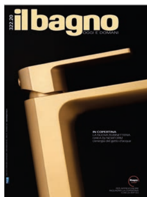
La copertina del Bagno Oggi e Domani 322. Soggetto: HAKA Video: Igor Ziloli

Scarica la App EG, inquadra la copertina, guarda il video ed entra subito nel mondo NEWFORM grazie alla realtà aumentata.